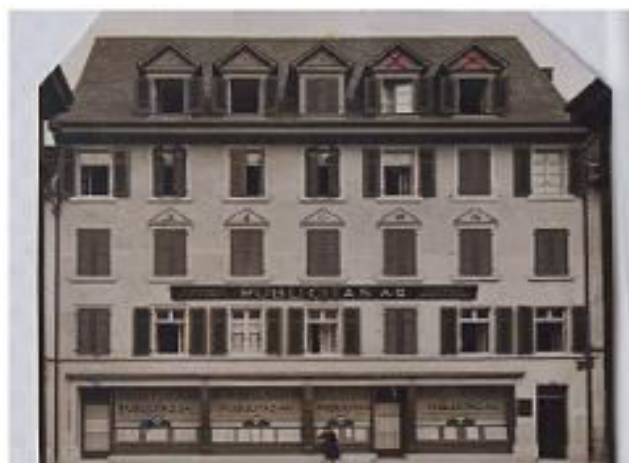
Wohnung Priester Schmocker

Die junge, ständig wachsende Gemeinde versammelte sich an verschiedenen Orten zum Gottesdienst, was auf einige Anfechtung und Erschwernisse in diesen schwierigen Jahren schliessen lässt: