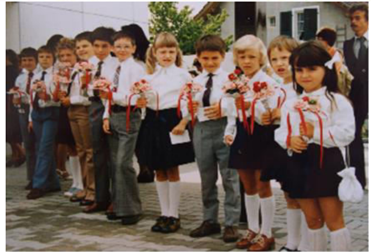
Unsere Kinder erwarten den Bezirksapostel